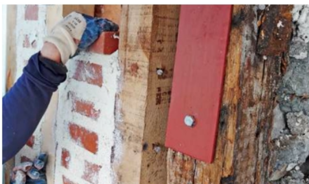
Opnieuw opvullen tussen houten secties.