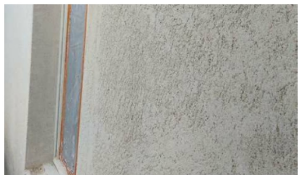
RPC klaar voor de eindlaag.