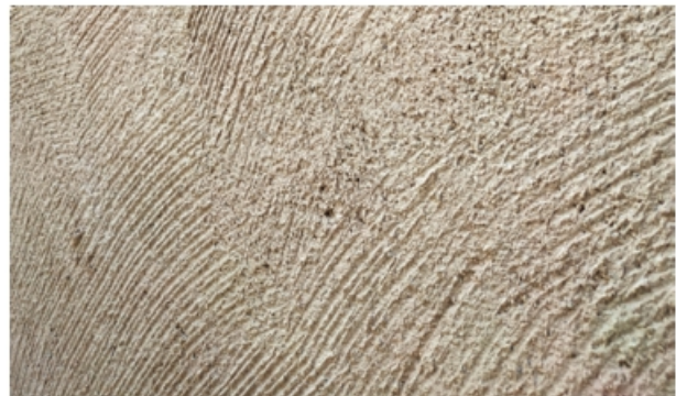
Ruwe laag RPC®.

Gebruik het product tussen 8°C en 30°C. Ondergrond voor gebruik bevochtigen en de mortel 48 uur na applicatie vochtig houden.