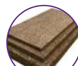
kurk en hennep